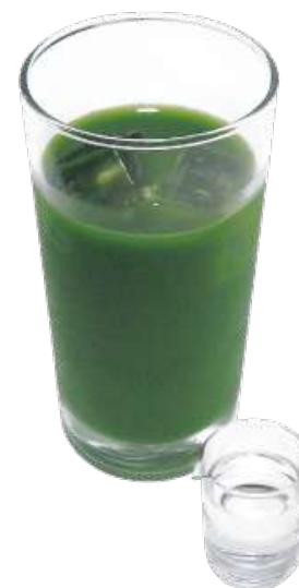
グリーンティー 990円