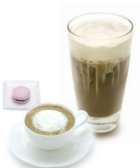
京ふわわ ほうじ茶 (アイス／ホット) お菓子つき 935円