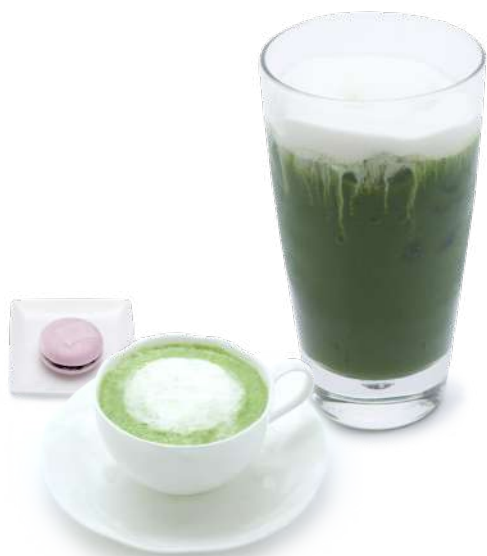
京ふわわ 抹茶 (アイス／ホット) お菓子つき 1,045円